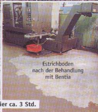
Estrichboden nach der Behandlung mit BENTIA