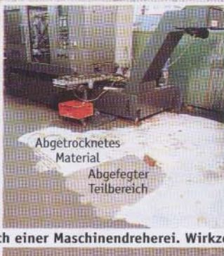
Abgetrocknetes Material Abgefegter Teilbereich