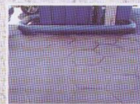
Entfernung von Diesel auf einer Tankstelle. Wirkzeit hier ca. 30 Min.

Mit unserem seit Jahren bewährten Produkt BENTIA ZR9030 konnte das Problem der Erneuerung für kontaminierte Hallen- und Werkstatböden sowie anderen Flächen auf revolutionäre Weise gelöst werden. Nach herkömmlicher Verfahrenstechnik mußten aufwendige Sanierungen in Form von Fräsarbeiten und Erneuerungen von Estrich- /Hallenböden vorgenommen werden. Mit dem Einsatz von BENTIA werden den Mineralöl verschmutzten Böden die Kohlenwasserstoffe entzogen und zurück an die Oberfläche befördert.