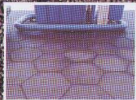
Ergebnis nach nur 10 Min.

BENTIA wurde an über 50 Ölen und Fetten erfolgreich getestet.