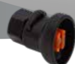
Flachstrahldüse (XR 8001 VS – XR 8008 VS) Art.Nr. 11612801-SB – 11612808-SB