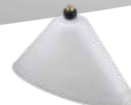
Sprühschirm oval, weiss Art.Nr. 10501606