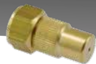
Regulierdüsen 1.3 mm und 1.7 mm Art.Nr. 28502598-SB, Art.Nr. 28502597-SB

Bewährtes Messing Handventil mit neuer Feststell- und Sperrfunktion.