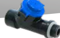
CF Ventile (Druck-Regelventil) 1 bis 2 bar Art.Nr. 11698401-SB – 11698403-SB