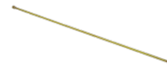
Verlängerung 1 m Art.Nr. 10960601