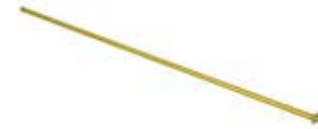
Teleskoprohr 1-2 m Art.Nr. 10985201