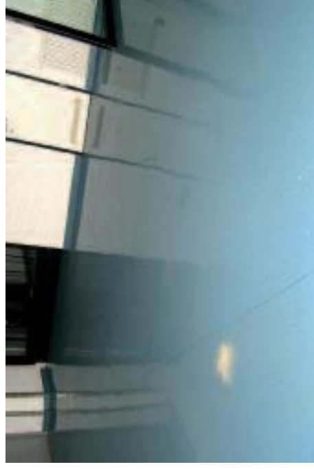
Gleiches Linoleum nach Grundreinigung mit Solex und Beschichtung mit Trigomat Brillant.