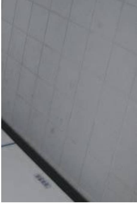
beseitigt schwerste Altverschmutzungen auf Laborfliesen...