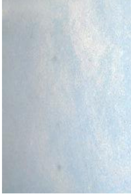
Linoleum mit Schäden infolge unkorrektem Einsatz von schwarzen Pads bei der Grundreinigung.